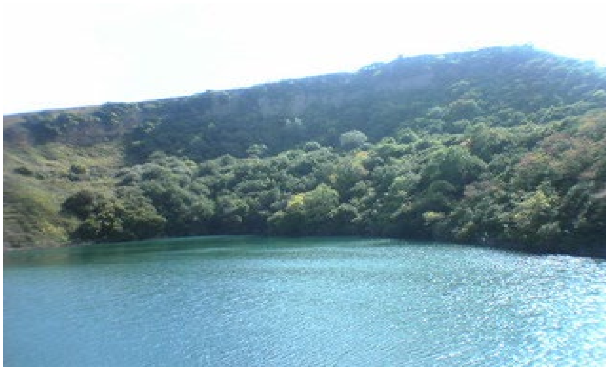
Карстовое озеро Шадхурей

На территории района располагается карстовое озеро Шадхурей в бассейне реки Малка близ села Каменноостское. Это провальное озеро, образовавшееся в результате выщелачивания известняков из-под песчаников.