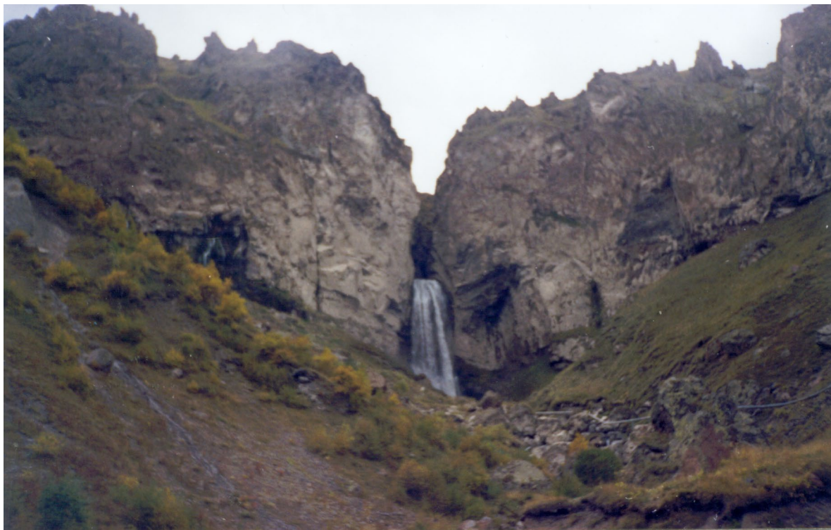
Водопад на р. Малка в районе Джылы-Су

построены искусственные водные трассы для рафтинга на байдарках и каноэ. Исключительно чистый горный воздух района с целебной ионизацией насыщен фитонцидами, родниковая вода кристальной чистоты и редкостной свежести, быстрые реки, текущие в берегах на фоне величественных гор, просторы цветущих альпийских лугов, украшенных рододендронами. К этому можно добавить также прекрасные климатические условия – это ли не самое богатство, которое должно сделать жизнь района достойной и обеспеченной.