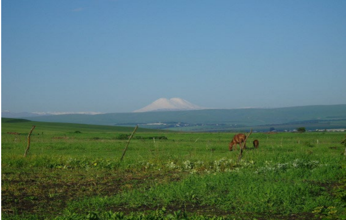
Альпийские луга. Вид на г. Эльбрус

долинах рек Малка и Золка, берущих свои истоки у подножия горы Эльбрус, самой высокой горы Европы (5642 м), расположенной на территории Зольского района.