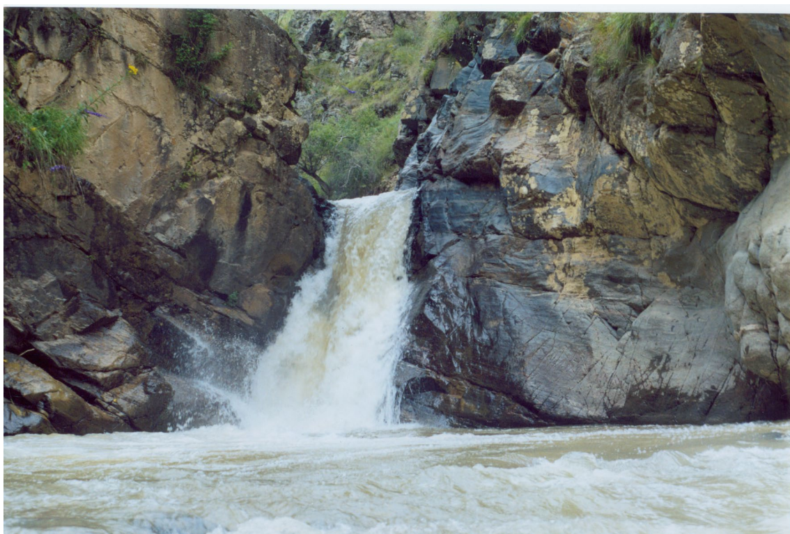
Водопад на р. Малка

Здесь прекрасная природа с высокими лесистыми горами, буйным разнотравьем, холмами, окаймляющими широкие плодородные долины и ущелья. В этих местах самое безоблачное в России небо, а ласковое солнце светит более 300 дней в году. Высокогорная часть района почти наполовину пересекается хребтом Шаукамнысырт.