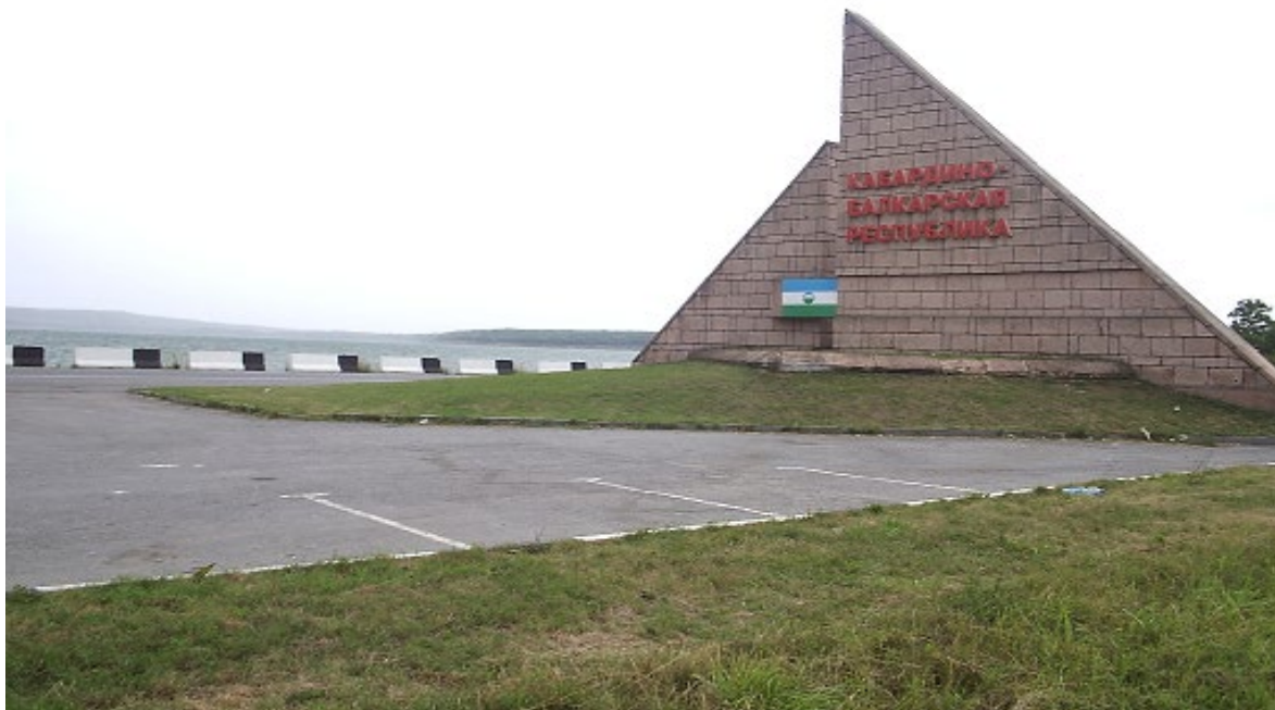
Въездная стела на границе со Ставропольским краем На заднем плане – озеро Тамбукан

Уникальные лечебные свойства имеет горячий источник, расположенный в с. Светловодское.